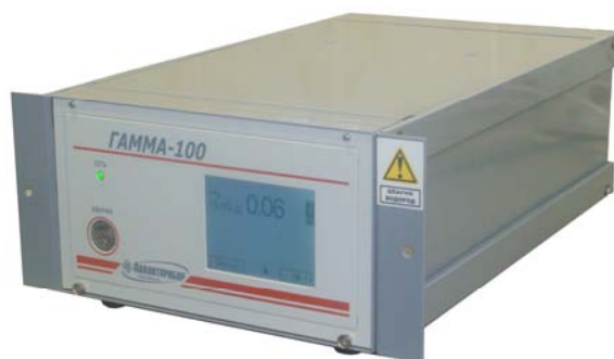
Рисунок 4. Внешний вид газоанализаторов с одним измерительным каналом