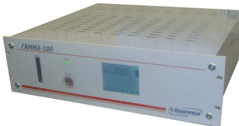
Рисунок 3. Внешний вид газоанализаторов с одним или двумя измерительными каналами