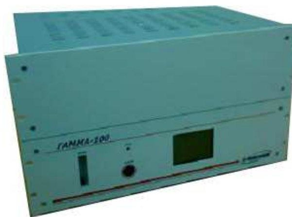
Рисунок 2. Внешний вид газоанализаторов с тремя измерительными каналами

Схема пломбировки от несанкционированного доступа и обозначение мест для нанесения оттисков клейм приведена на рисунке 5.