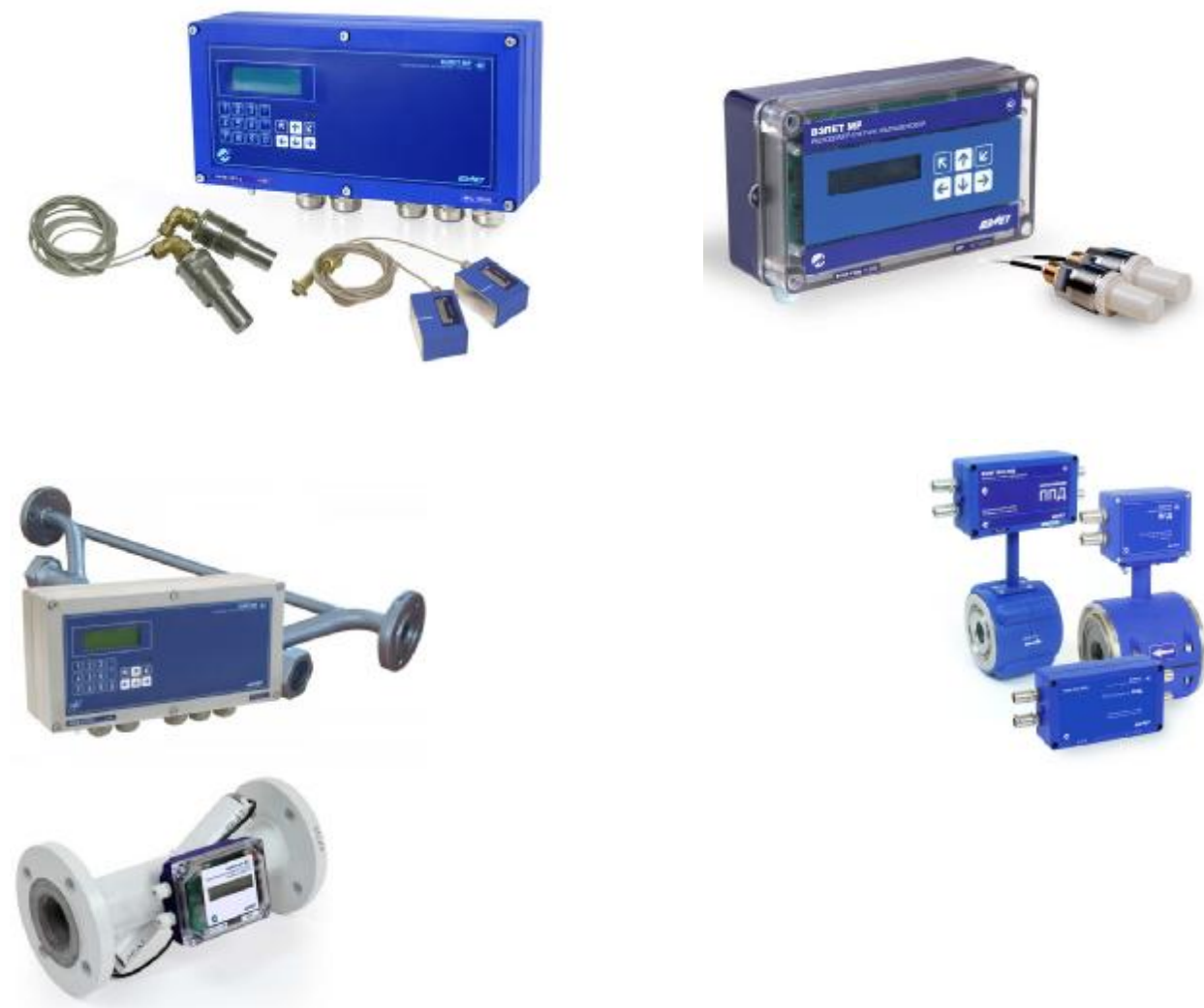
Рисунок 1 - Общий вид расходомеров-счетчиков ультразвуковых «ВЗЛЕТ MR» различных исполнений

УРСВ-ППД-XXX X— учет воды в системах поддержания пластового давления, одно-, двухлучевая схема зондирования.