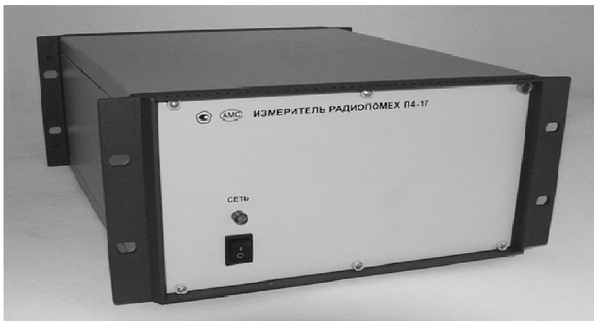
Рисунок 1 – Общий вид измерителя

Фотография общего вида измерителя приведена на рисунке 1.