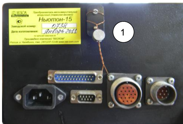
Рисунок 2 — Схема пломбировки (1 — пломбировочная пластина на тумблере переключения режимов)

Пломбировке от несанкционированного доступа подвергается тумблер переключения режимов работы (настройки) дозатора на задней панели вторичного весоизмерительного преобразователя (рисунок 2).