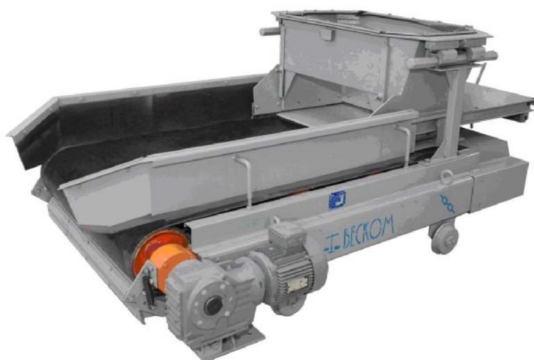
Грузоприемное устройство в сборе с вибропитателем (для мод. КЛИМ-ВД-600-1350)

Общий вид ГПУ и блока управления приведен на рисунке 1.