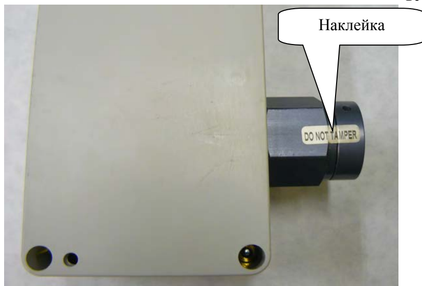
Рисунок 2 – Схема пломбировки сигнализатора от несанкционированного доступа