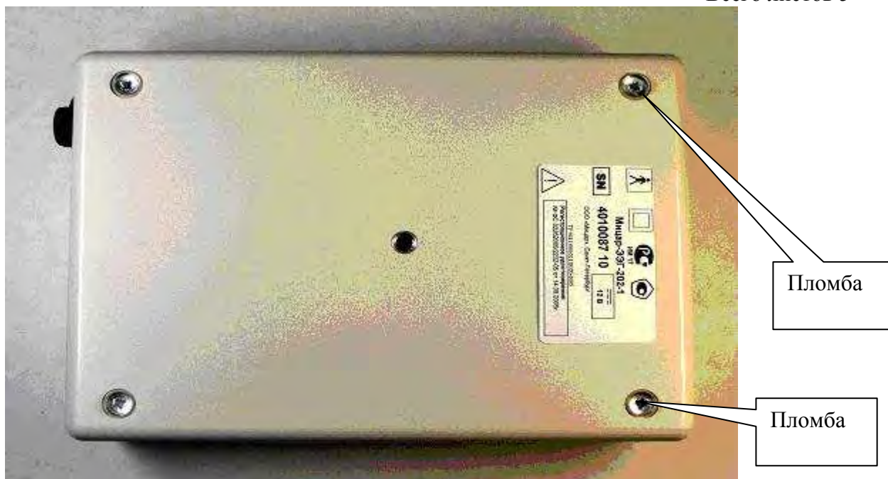
Рисунок 2 - Комплекс аппаратно-программный электроэнцефалографический "Мицар-ЭЭГ-202", расположение пломб.