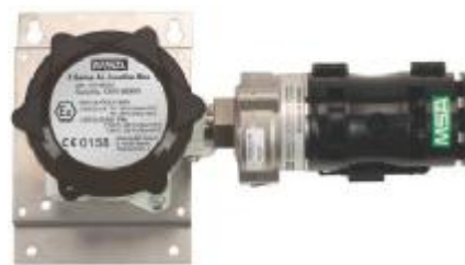
з) PrimaX IR