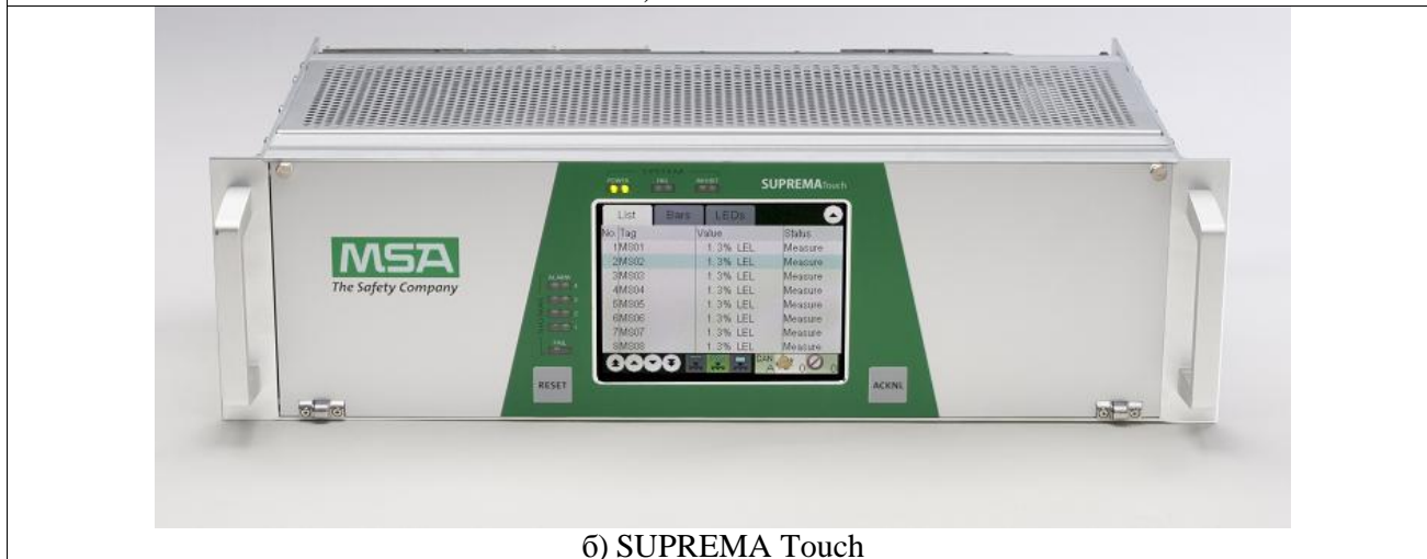
б) SUPREMA Touch