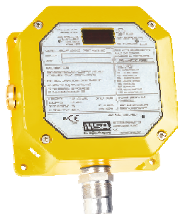
в) ULTIMA MOS-5E