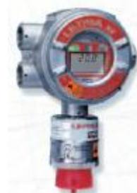
б) Ultima XE