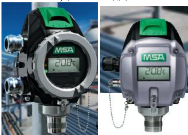
д) PrimaX P, PrimaX I