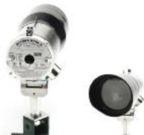
ж) ULTIMA OPIR-5