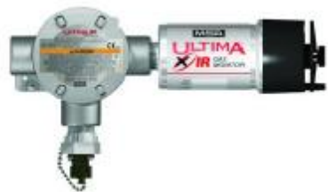
а) Ultima XIR