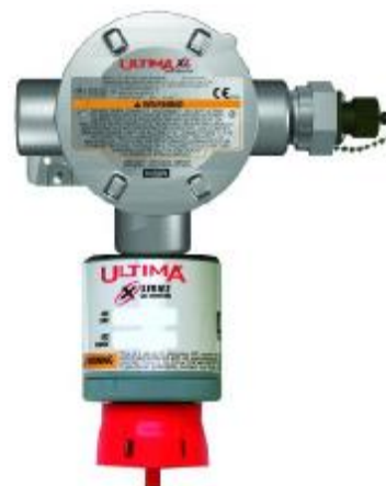
е) ULTIMA XL