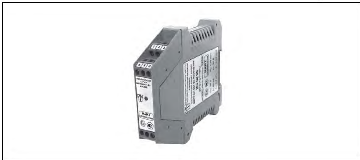
Рисунок 1 - Фото общего вида

Контроль несанкционированного доступа внутрь блока обеспечивается разрушающимися при попытке вскрытия наклейками с товарным знаком изготовителя.