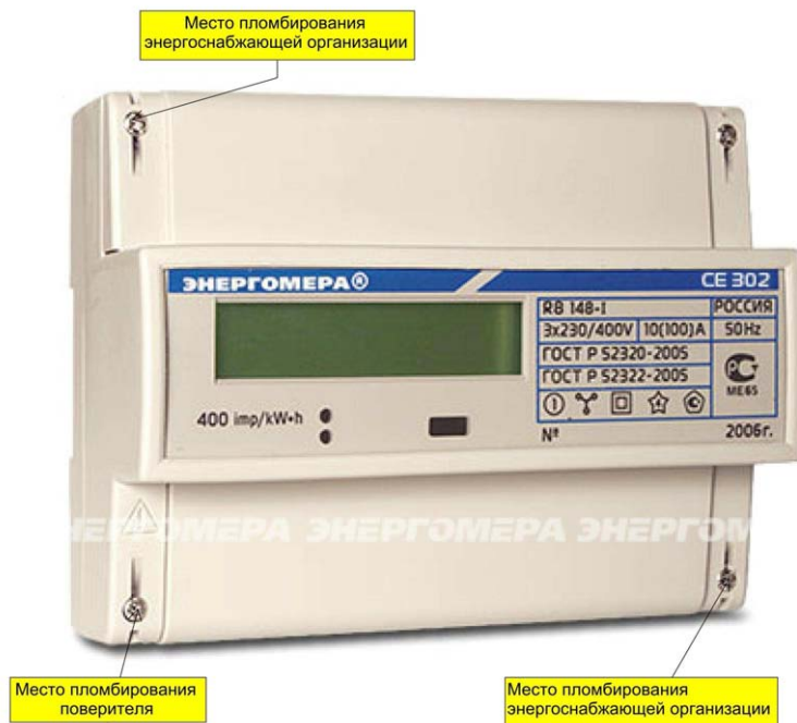
Рисунок 3 – Общий вид счетчика CE302 R31