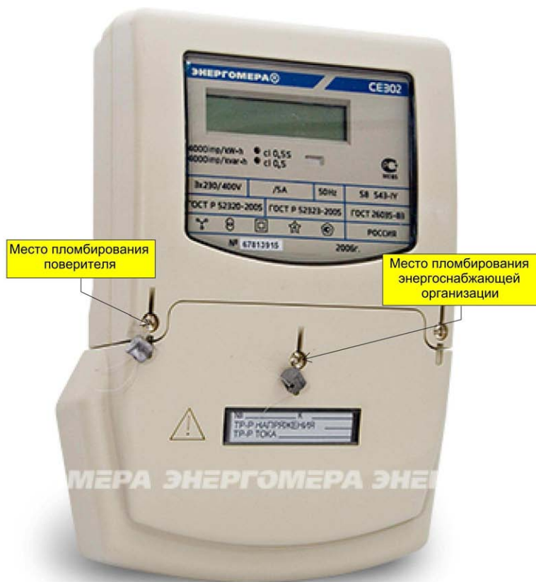
Рисунок 2 – Общий вид счетчика CE302 S33