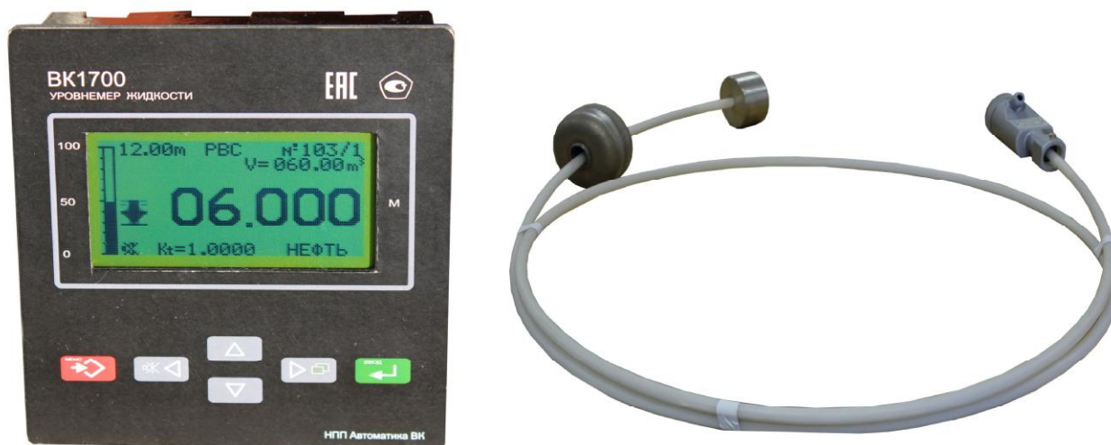
Рисунок 1 - Общий вид уровнемеров ВК1700

Общий вид уровнемеров представлен на рисунке 1.