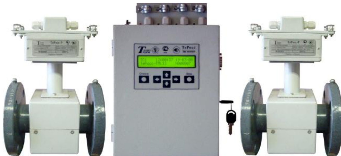
Рисунок 1-Общий вид теплосчетчика

На корпусах вычислителя и преобразователя расхода предусмотрены места для пломбирования.