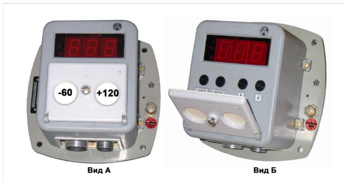
Рисунок 1 – Общий вид измерителя-сигнализатора температуры ИСТ Вид А – закрытая крышка и границы диапазона сигнализации Вид Б – открытая крышка и органы управления

Общий вид измерителя-сигнализатора температуры ИСТ и места пломбирования представлены на рисунках 1 и 2 соответственно.