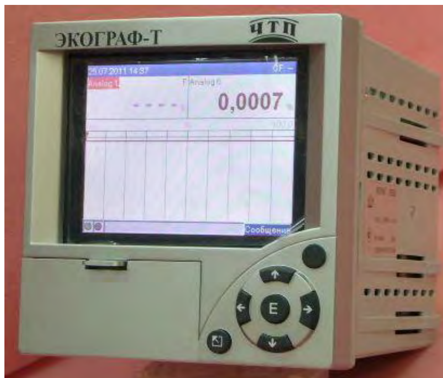
Рисунок 1 – Фотография общего вида