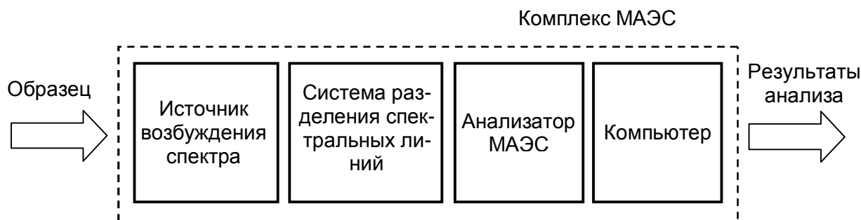
Рисунок 1 - Блок-схема комплекса МАЭС.

Маркировка монтируется на переднюю/заднюю/боковую стороны спектрального прибора (в зависимости от его модели). Пломба наносится на один из винтов спектрального прибора.