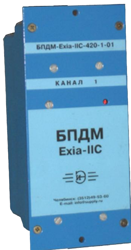
Рисунок 1 – Фотография общего вида щитового исполнения