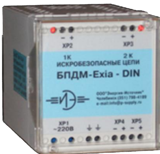
Рисунок 2 – Фотография общего вида исполнения DIN

Схемы пломбировки от несанкционированного доступа приведены на рисунках 3, 4.