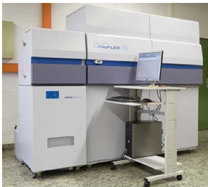
Рисунок 2 – Общий вид спектрометра эмиссионного тлеющего разряда GD-Profilер HR