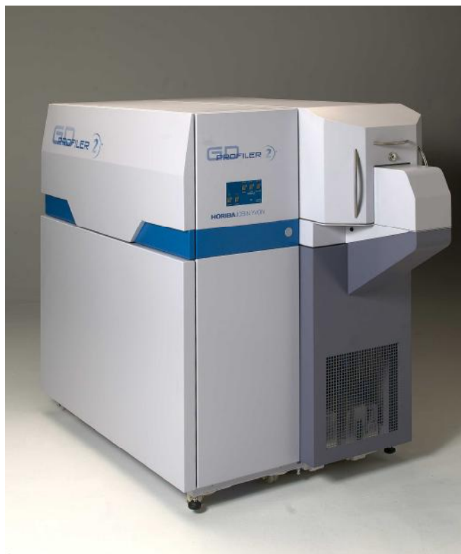
Рисунок 1 – Общий вид спектрометра эмиссионного тлеющего разряда GD-Profilер 2