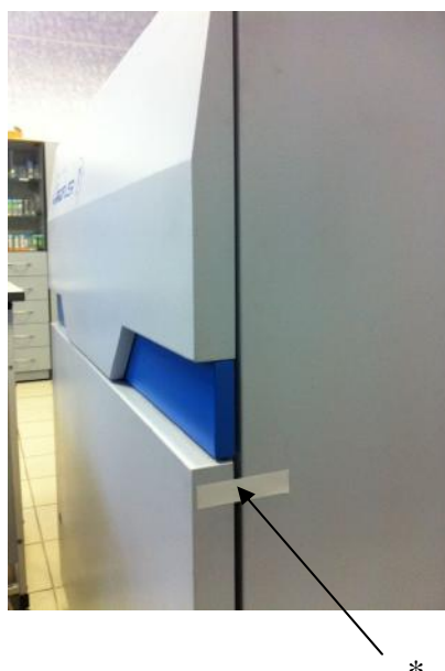
Рисунок 4 – спектрометры GD-Profilер 2 и GD-Profilер HR- вид сзади, *- место пломбирования