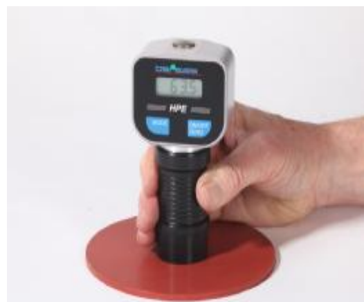
Рисунок 1 - Внешний вид твердомеров HP-D, HP-DS – А), HPE II Shore D – Б).