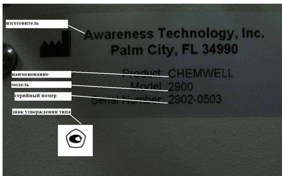
Рисунок 4 – Схема маркировки (задняя панель анализатора)