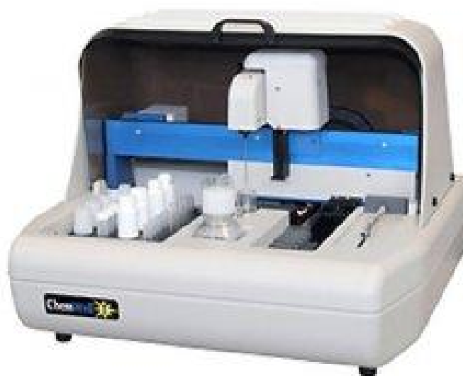
Рисунок 1 – Общий вид анализатора Chem Well 2900

Анализатор Chem Well 2900 представляет собой одноканальный горизонтальный фотометр. Анализаторы Chem Well 2902 и Chem Well 2910 представляют собой 4-х канальные вертикальные фотометры, с одновременным измерением оптической плотности в четырех лунках планшета.