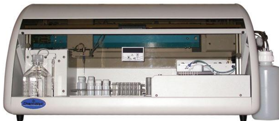
Рисунок 3 – Общий вид анализатора Chem Well 2910