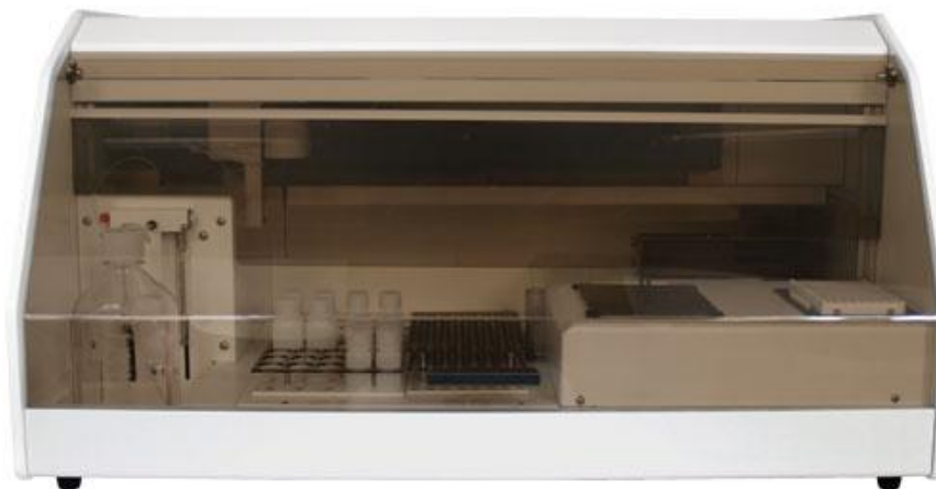
Рисунок 2 – Общий вид анализатора Chem Well 2902