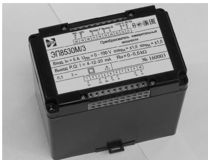
Рисунок 2 - Внешний вид ИП в корпусе с габаритными размерами 125×90×125 мм