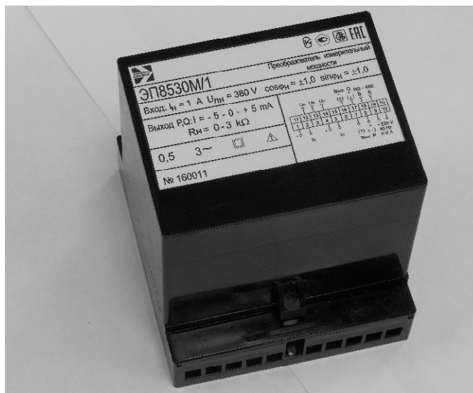
Рисунок 1 - Внешний вид ИП в корпусе с габаритными размерами 110×120×125 мм

Схемы пломбировки от несанкционированного доступа и указания мест для нанесения оттиска клейма ОТК и оттиска клейма знака поверки средств измерений на ИП приведены на рисунках 3 и 4.