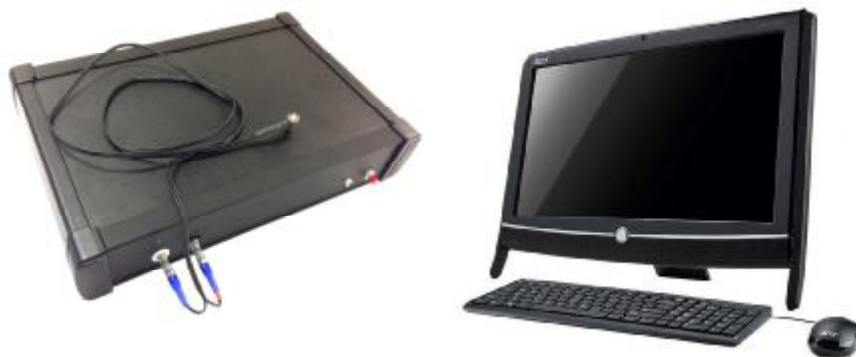
Рисунок 1 – Общий вид толщиномеров

Конструктивно толщиномеры состоят из электронного блока, ультразвукового преобразователя с номинальными частотами от 0,5 до 15 МГц, персонального компьютера, на который устанавливается программное обеспечение (ПО). Фотография общего вида толщиномеров представлена на рисунке 1.