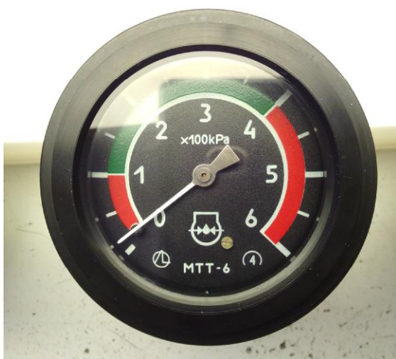
Рисунок 1 – Общий вид манометра технического тракторного МТТ

Пломбирование манометров изготовителем не предусмотрено.