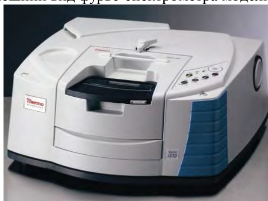
Рисунок 2. Внешний вид фурье-спектрометра модели Nicolet iS10