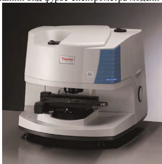
Рисунок 3. Внешний вид фурье-спектрометра модели Nicolet iN10