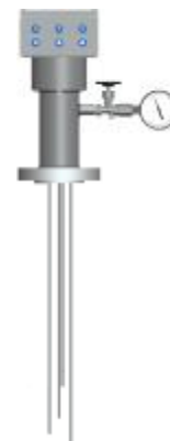
Рис.9 - S96-FX