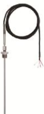
Рис.6 - S80