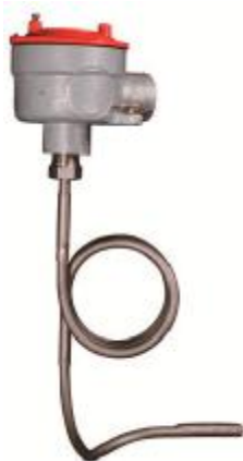
Рис.5 - S70