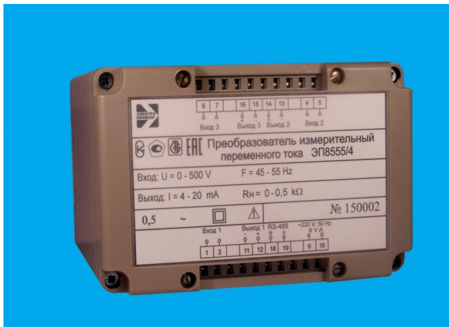
Рисунок 2 – Общий вид средства измерений ЭП8555/3 - ЭП8555/5, ЭП8555/7