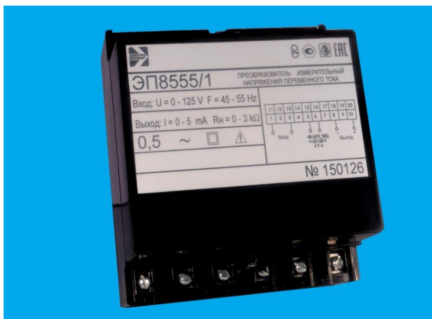
Рисунок 1 – Общий вид средства измерений ЭП8555/1 - ЭП8555/9

Схема пломбировки от несанкционированного доступа, обозначение места нанесения знака поверки представлены на рисунках 3 и 4.