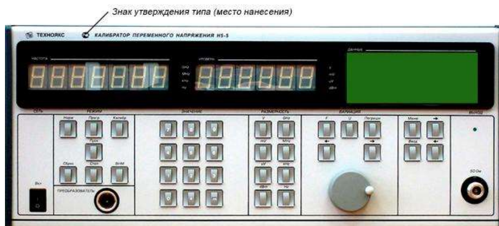
Рисунок 1 - Внешний вид калибратора (вид спереди)

По условиям эксплуатации калибраторы удовлетворяют требованиям группы 1.1 по ГОСТ РВ 20.39.304-98 климатического исполнения УХЛ с диапазоном рабочих температур от 5 до 40 °С и относительной влажностью окружающего воздуха до 90 % при температуре 30 °С.