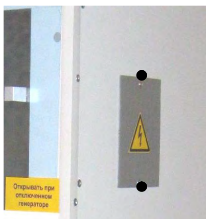
Рисунок 2 – Конденсатор ● - места пломбирования от несанкционированного доступа