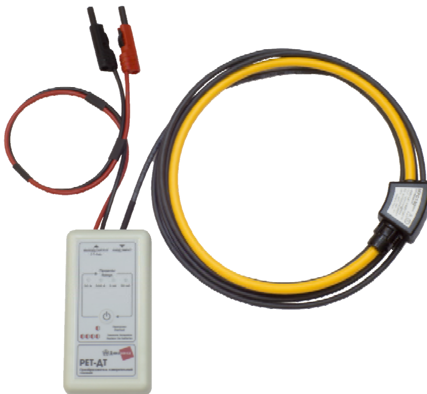
Рисунок 1 – Общий вид спереди преобразователя

Общий вид преобразователя представлен на рисунке 1. Общий вид сзади преобразователя (без крышки батарейного отсека) и место пломбировки от несанкционированного доступа представлены на рисунке 2.