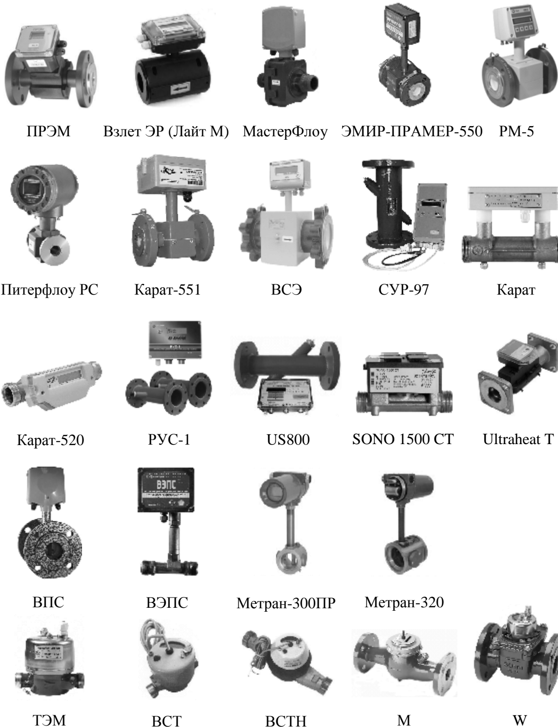
Рисунок 2 - Преобразователи расхода. Общий вид