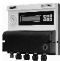
Рисунок 1 - Тепловычислитель СПТ943. Общий вид