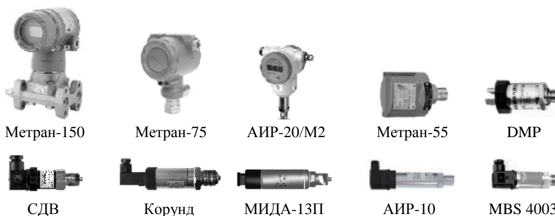
Рисунок 4 - Преобразователи давления. Общий вид