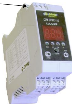
Рис. 2 Система газоаналитическая многофункциональная СГМ ЭРИС-110 (DIN-рейка)