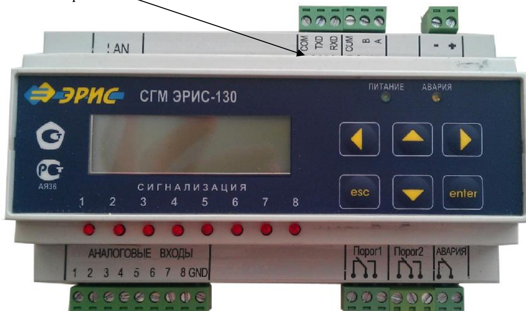
Рис. 4 Система газоаналитическая многофункциональная СГМ ЭРИС-130 (DIN-рейка)