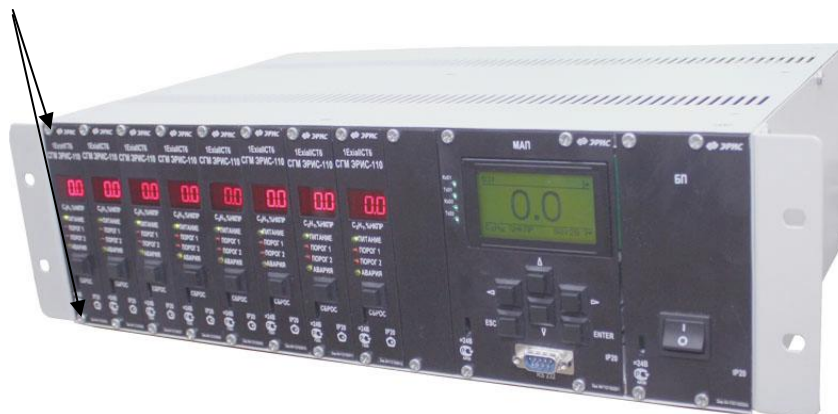
Рис. 1 Система газоаналитическая многофункциональная СГМ ЭРИС-110 (19" слот)