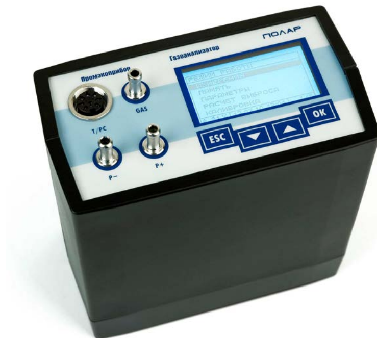
Рисунок 1 – Внешний вид газоанализаторов «Полар»

Конструкцией газоанализатора предусмотрена пломбировка корпуса от несанкционированного доступа в месте установки одного из винтовых соединений. Схема пломбировки и размещения обозначение места наклейки «знак поверки» приведена на рисунке 2.