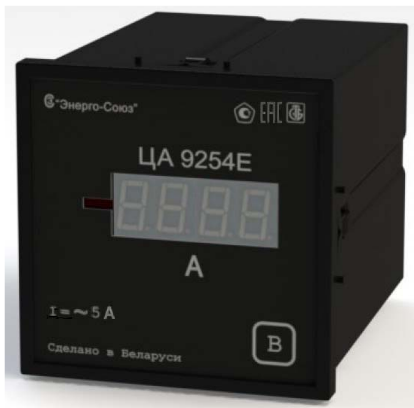
Рисунок 1 - Общий вид преобразователя