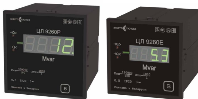
Рисунок 1 – Внешний вид ИП