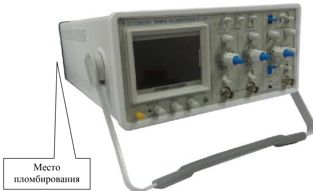
Рисунок 3 - Внешний вид осциллографа С1-127 (ЖКИ).