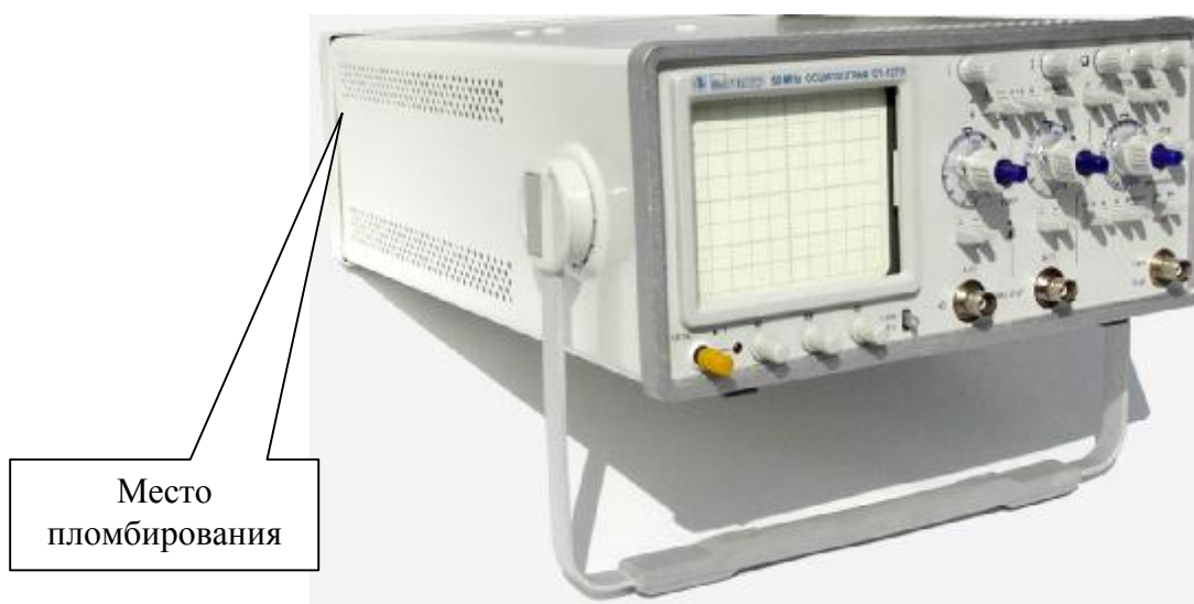
Рисунок 2 - Внешний вид осциллографа C1-127/1