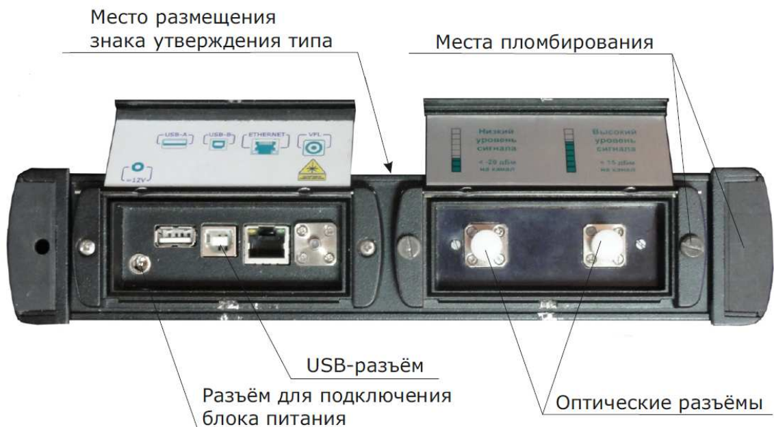
Рисунок 2 – Фотография верхней панели СИ

Верхняя панель анализатора с указанием расположения основных разъемов, места размещения знака утверждения типа и места пломбирования прибора представлена на рисунке 2.