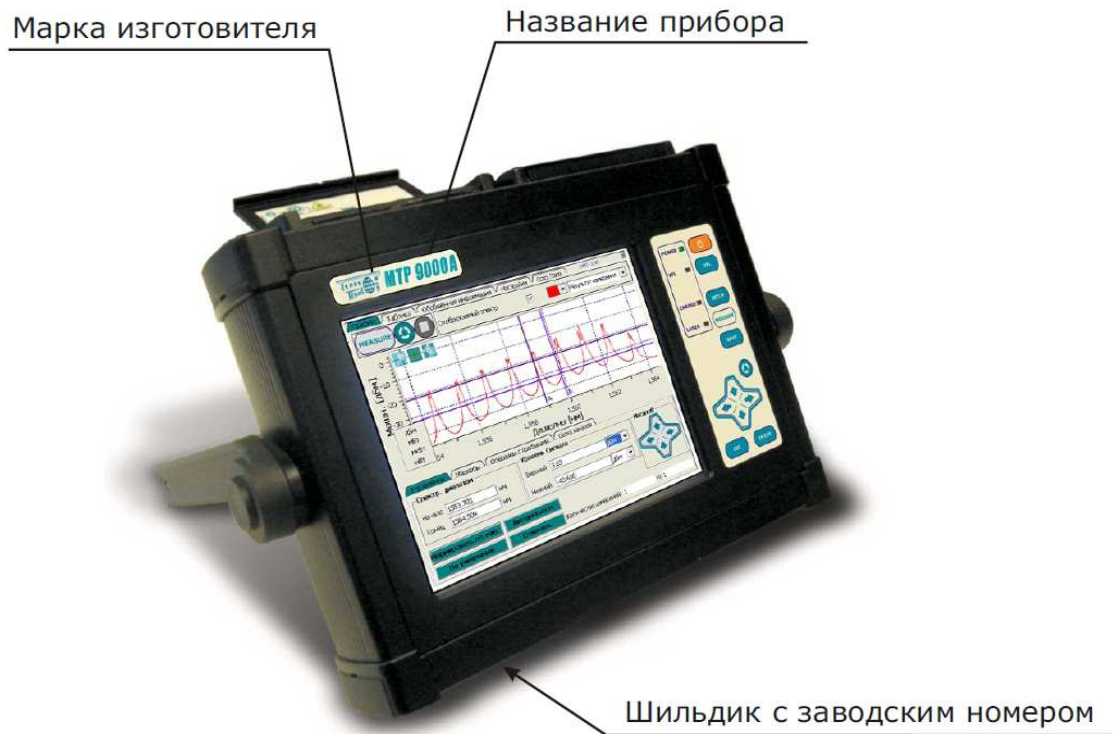
Рисунок 1 - Фотография общего вида СИ

Верхняя панель анализатора с указанием расположения основных разъемов, места размещения знака утверждения типа и места пломбирования прибора представлена на рисунке 2.