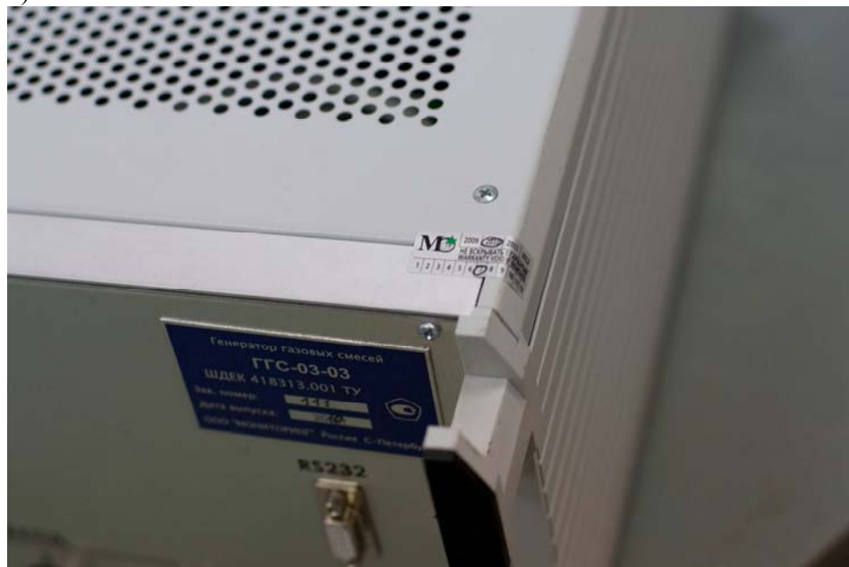
Рис 1 Внешний вид генератора ГГС-03-03