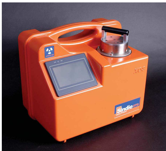
Внешний вид анализатора приведен на рис. 1.