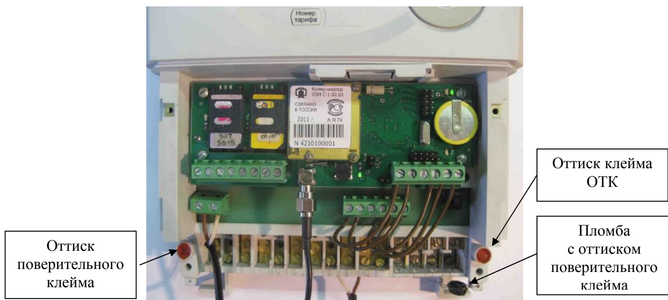
Рисунок 2 – Внешний вид отсека для установки дополнительных интерфейсных модулей

Внешний вид отсека для установки дополнительных интерфейсных модулей с установленным коммуникатором GSM C-1.02.01 приведен на рисунке 2.