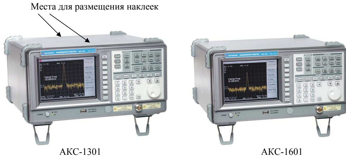
Рисунок 1- Общий вид анализаторов спектра

Фотографии общего вида анализаторов спектра и места размещения наклеек представлены на рисунке 1. Схема пломбировки от несанкционированного доступа изображена на рисунке 2 (вид прибора снизу).