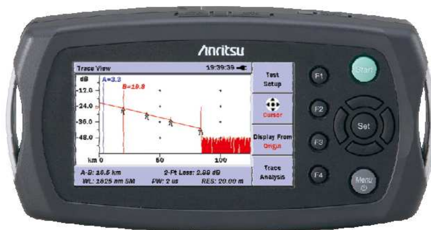
Рисунок 2 - Внешний вид системы оптической измерительной MT9090A