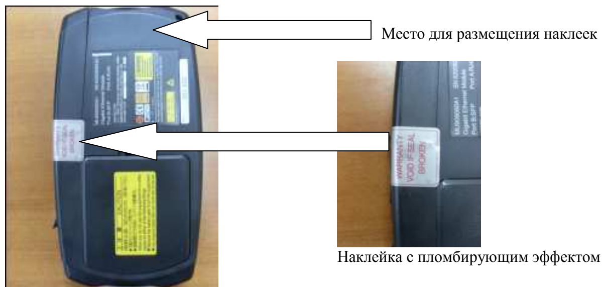
Рисунок 3 - Схема пломбирования от несанкционированного доступа и обозначение места для размещения наклеек