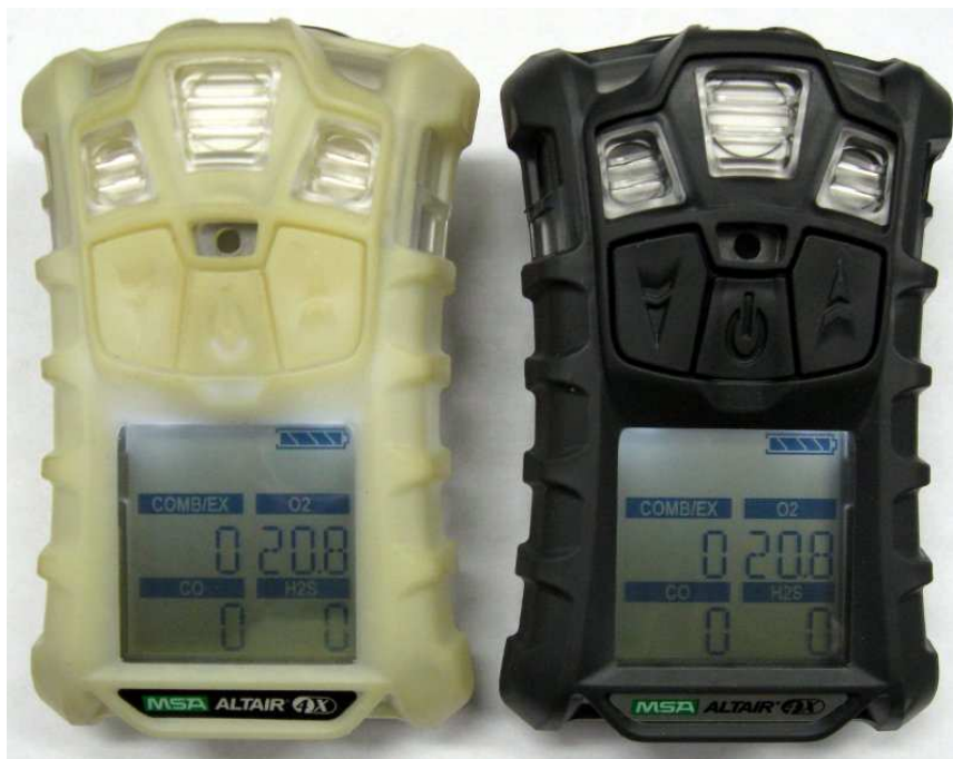
Рисунок 1 - Газоанализаторы портативные ALTAIR 4X (слева версия с фосфоресцирующим корпусом, справа - обычным)