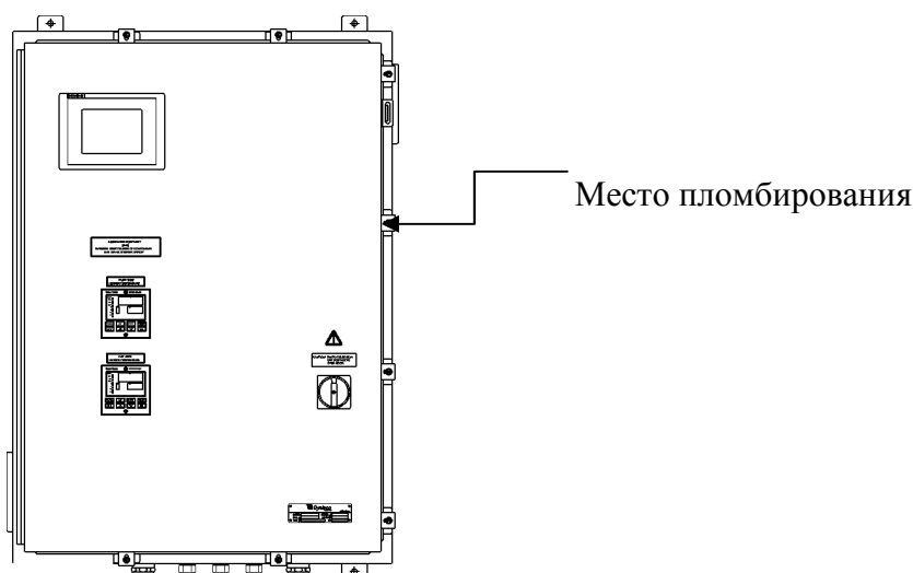
Рисунок – Схема пломбирования блока управления от несанкционированного доступа

Программное обеспечение защищено (уровень защиты А в соответствии с МИ 3286-2010) кодом доступа изготовителя (шесть уровней доступа). Изменение программного обеспечения возможно с использованием специальных программно-аппаратных средств при условии разрушения целостности пломбировки блока управления.