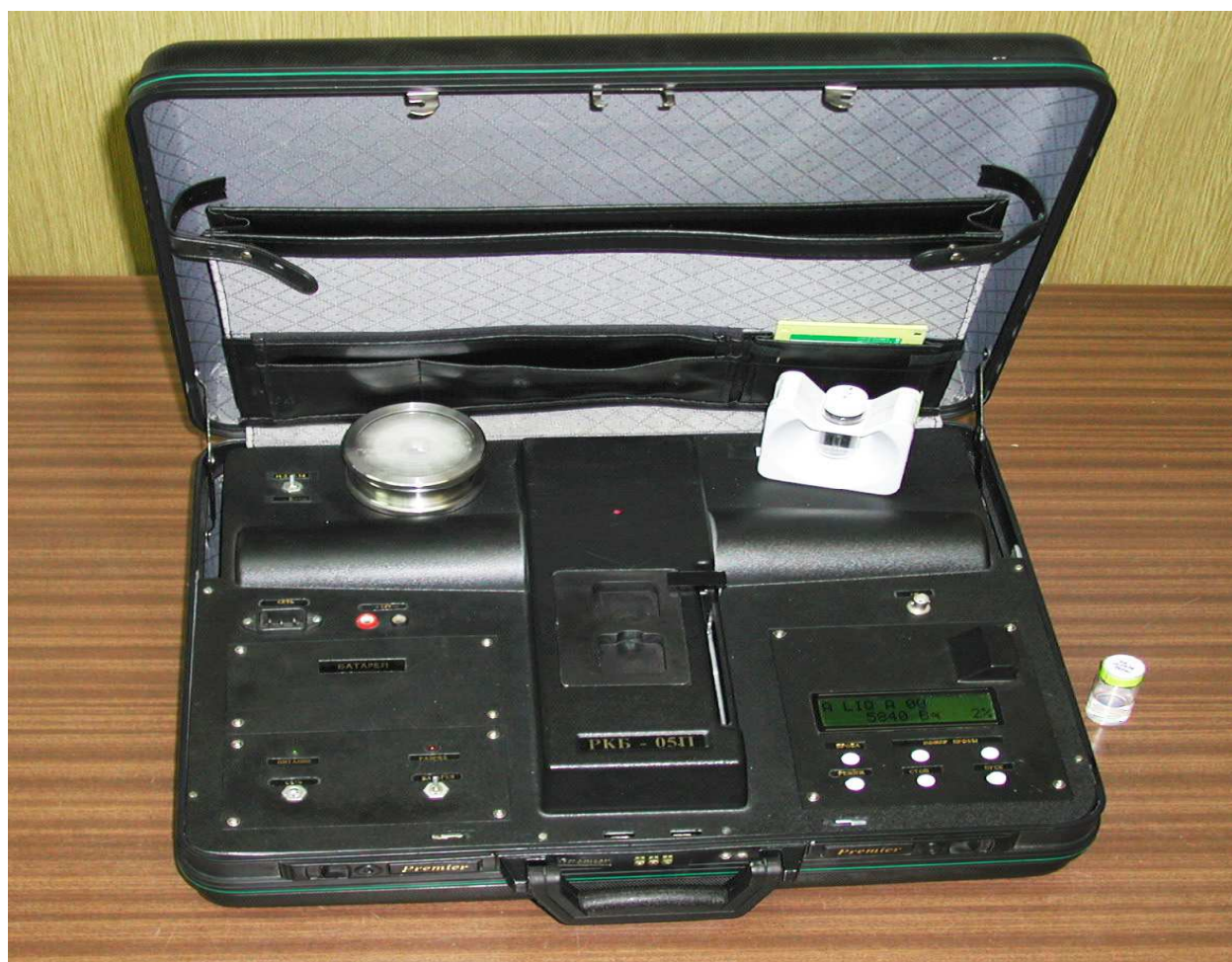
Рисунок 2 – Фотография общего вида радиометра РКБ-05П