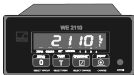
Прибор весоизмерительный WE2110

Внешний вид весов представлен на рисунке 1