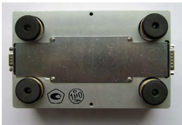
Рисунок 2 - Микроскоп сканирующий зондовый «СММ-2000», измерительная головка, вид снизу; указаны места нанесения знака утверждения типа и поверительного клейма