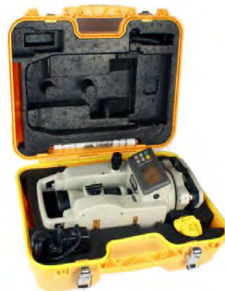
Рисунок 4 - Внешний вид размещения теодолита в футляре