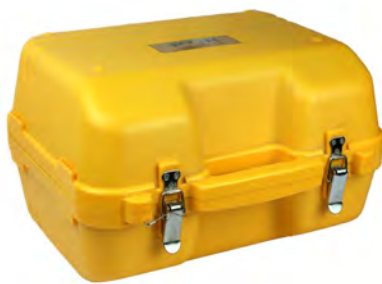
Рисунок 3 - Внешний вид футляра