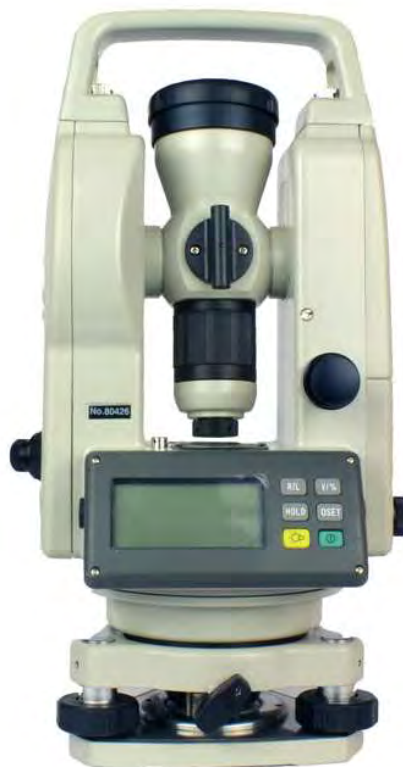
Рисунок 1 - Внешний вид теодолита

Схема обозначения мест для размещения наклеек приведена на рисунке 6.