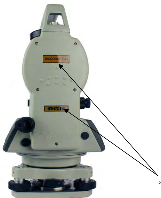
Рисунок 5 - Схема пломбировки от несанкционированного доступа

Примечание * - обозначения мест для размещения наклеек