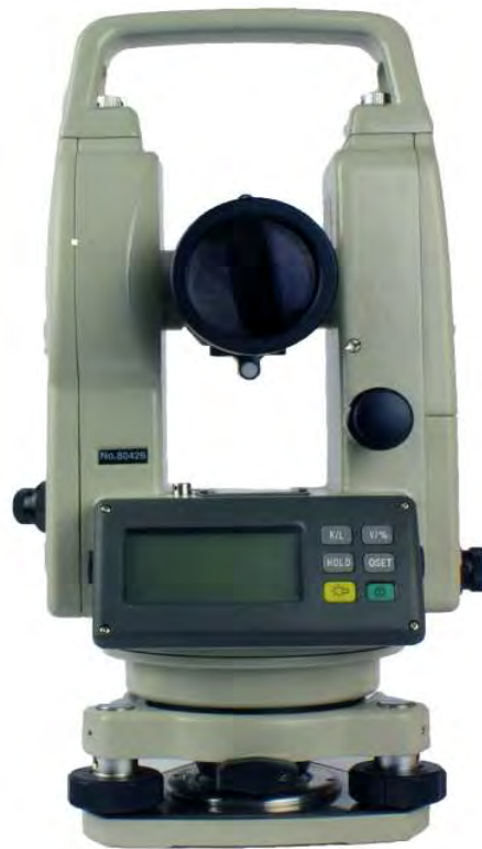
Рисунок 2 - Внешний вид теодолита