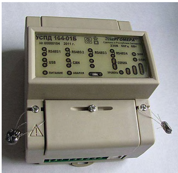
Рисунок 1 – Внешний вид УСПД 164-01Б-0 и УСПД 164-01Б-1

Схема пломбировки показана на рисунке 2.