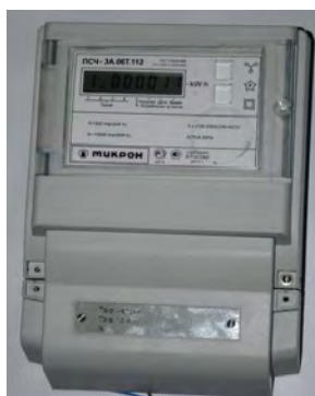
Рисунок 2 – внешний вид счетчика ПСЧ-3А.06Т