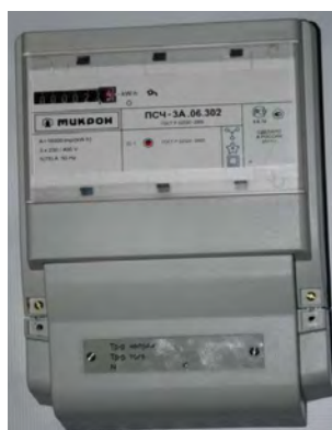
Рисунок 3 – внешний вид счетчика ПСЧ-3А.06