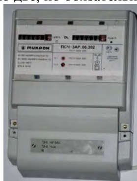
Рисунок 1 – внешний вид счетчика ПСЧ-3АР.06

Внешний вид счетчиков ПСЧ-3АР.06Т с закрытой клеммной крышкой и схема пломбирования приведены на рисунках 1, 2, 3 и 4. Из четырех пломб обслуживающей организации могут устанавливаться только две, но обязательно слева и справа.