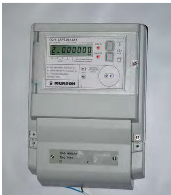
Рисунок 1 – Внешний вид счетчика с закрытой крышкой клеммной колодки