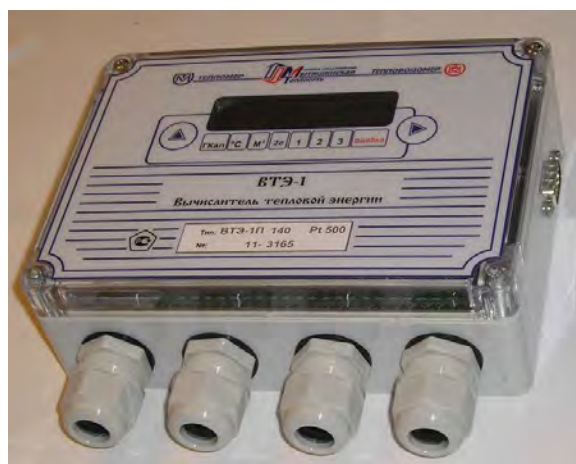
а) б) Внешний вид вычислителя тепловой энергии ВТЭ-1 а) модификация - К; б) модификация - П

Место нанесения поверительного клеима в виде наклейки