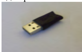
Рисунок 2. Внешний вид HASP-ключа

Система защиты программного обеспечения счетчиков электрической энергии однофазных типа АЭ-1 основана на надежной технологии HASP.