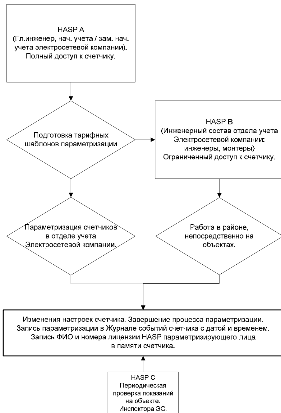
Схема 1. Структура распределения HASP-ключей в электросетевой компании

Кроме программной защиты существует еще один дополнительный уровень механической защиты параметризации счетчика. Механическая защита параметризации реализована кнопкой на внешней панели счетчика.