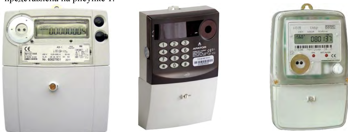
Рисунок 1 Фотография общего вида счетчиков электрической энергии однофазных типа АЭ-1.

Фотография общего вида счетчиков электрической энергии однофазных типа АЭ-1 представлена на рисунке 1.